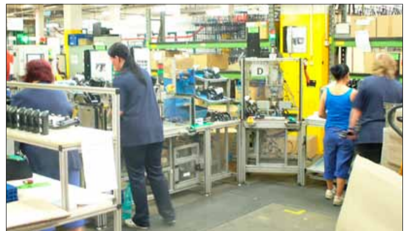
Montáž pedálů Audi. Jedno z pracovišť v SBU CS Rakovník

Kvůli pandemii koronaviru se situace mění v celé České republice každou chvíli. Má to samozřejmě i dopad na naše branecká zařízení jako je BRANO SAUNA, prodejna BRANOMARKET či hotel BRANS v Malé Morávce. Sledujte proto dané webové stránky www.branomarket.cz , www.brans.cz , www.bs-studio.cz . (mp)