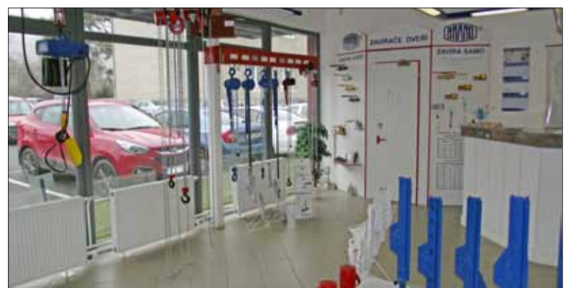
BRANOMARKET v Hradci nad Moravicí má svou prodejnu stále otevřenou. Je možné tedy využívat jejich služeb