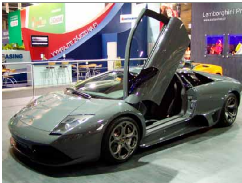
Jeden z vozů proslulé automobilky Lamborghini Murciélago