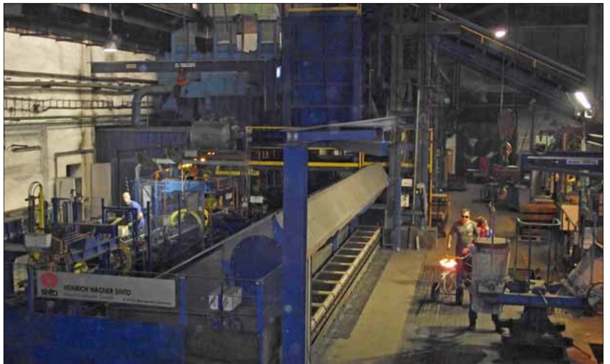
Slévárnu čeká další investiční akce