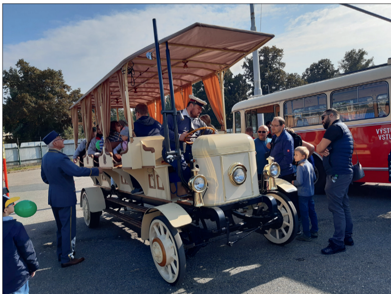
Lákala by vás jízda takovým autobusem? Naši předci si uměli poradit. Na svou dobu moderní dopravní prostředek. Tak jestli budete mít příležitost, neváhejte