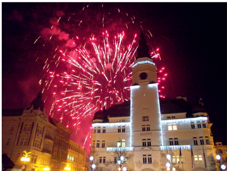
S dobrou náladou, optimismem a nadějí vstupte do nového roku 2022