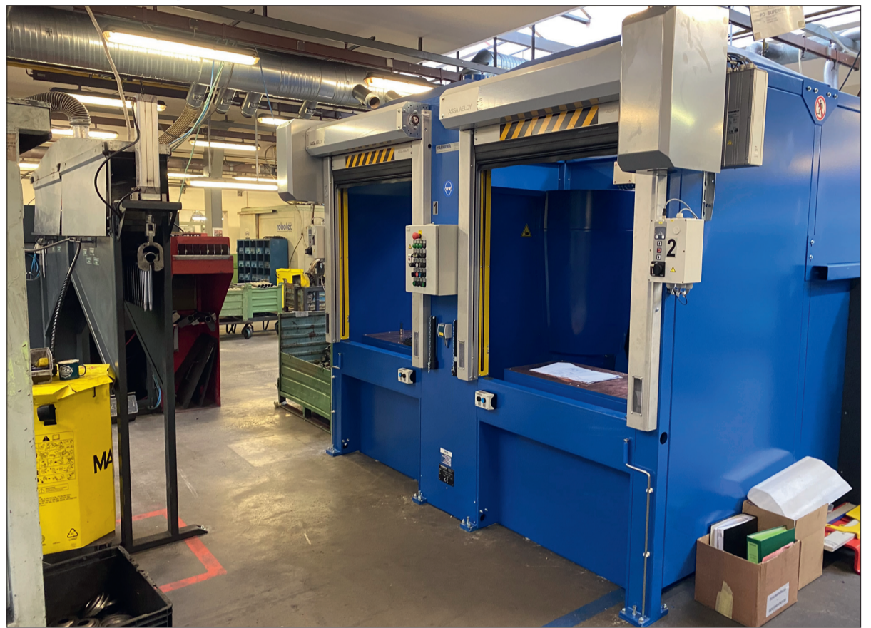
Moderní zařízení se již nachází na svém místě v SBU CV