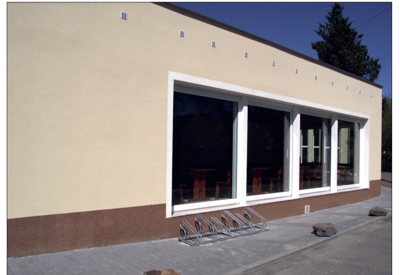
BRANO SAUNA nabízí širokou škálu služeb