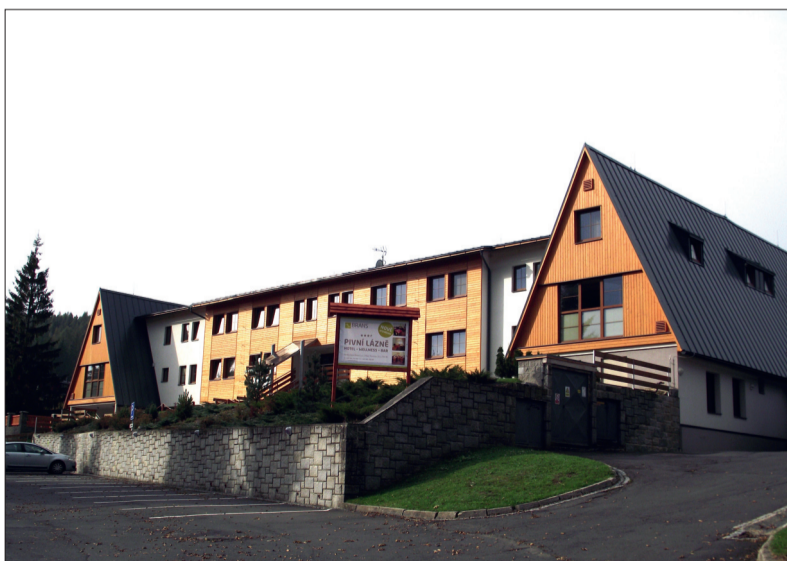
Hotel BRANS leží v malebném prostředí Jeseníků

Je to již neuvěřitelných deset let od doby, kdy byly, po rozsáhlé rekonstrukci, otevřeny objekty sloužící zaměstnancům BRANO GROUP k načerpání nových sil a odpočinku. Řeč je o hotelu BRANS v Malé Morávce a zařízení BRANO SAUNA v Hradci nad Moravicí.