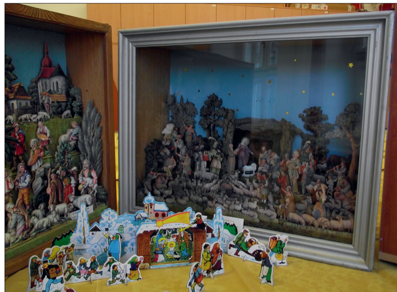
A jaký betlém máte doma vy?

Muzeum spravuje jak městské sbírky (nejzávažnější je ručně psaný iluminovaný Literátní graduál z roku 1559), tak sbírkový fond betlémů. Betlémů zde mají více než 300 kusů, a to zhotovených z různých materiálů. Nejcenějším je Proboštův betlém. Jde o mechanický a více než sto let starý unikát. Vyroben je celý ze dřeva, kromě kovových zvonků, kožených řemenů a měchu kukačky. Jeho úctyhodné rozměry mají 7 x 3 x 2 metry. Betlém obsahuje na dva tisíce vyřezávaných figurek a dílů, jejich pohyb zajišťuje ojedinělý mechanismus, jenž byl původně poháněn klikou a od roku 1935 již elektrickým motorkem. Autory tohoto vysoce uměleckého díla