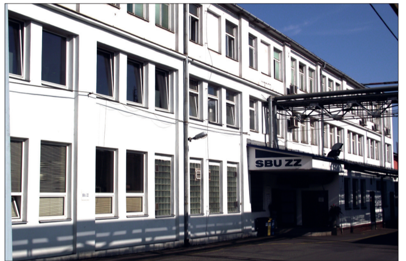
Z SBU ZZ míří hevery do Francie