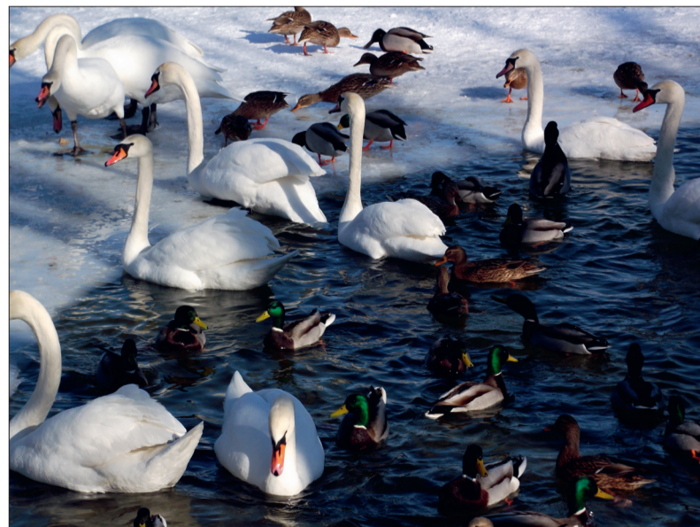
Zimní příroda má něco do sebe a umí překvapit. Přímou pastvu pro oči i duši