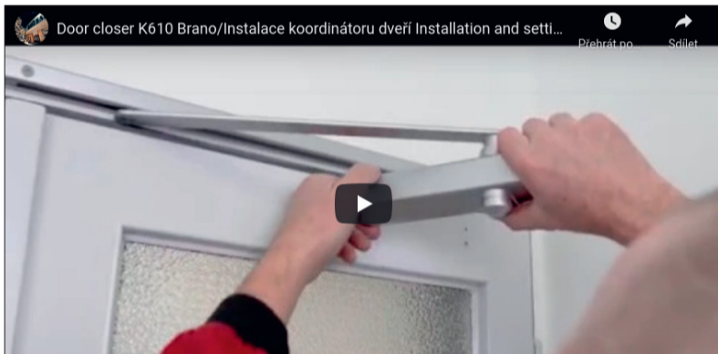
Video návod ukáže jak na to

Jak správně namontovat lištový koordinátor z produkce BRANO? K tomu slouží vysvětlující video, které je zájemcům k dispozici rovněž na webu Stavebniserver.com. Kromě videonávodu je zde i detailní popis našeho výrobku.