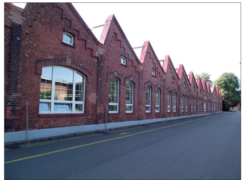
Svět jménem BRANO jede stále dál

PROSINEC – Vzhledem k vánočním svátkům noviny nevycházejí. Poslední letošní číslo mělo rozšířenou verzi.