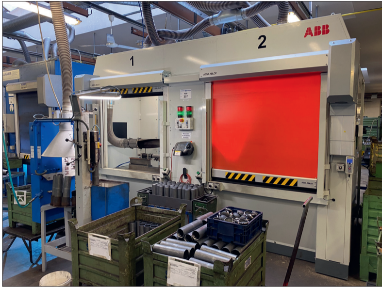
Výborná spolupráce s firmou ABB

Tím ovšem investice v Jilemnici nekončí. „V příštím roce bychom se investičně chtěli soustředit na modernizaci obrábění pístnic, tak abychom navýšili potřebné kapacity pro zajištění požadavků našich zákazníků. Celou výrobní kapacitu tlumičů cílíme na 3000 ks za den,“ dodává Ladislav Charvát. (mp)