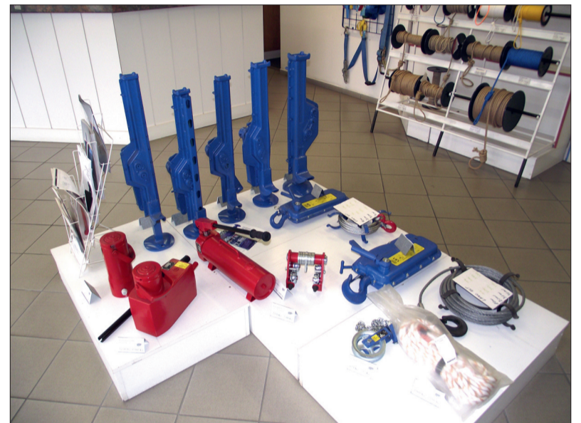
BRANOMARKET má velmi pestrý sortiment