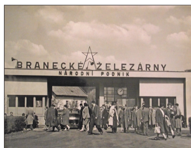
▲ Lidé jdou z práce, psal se rok 1962