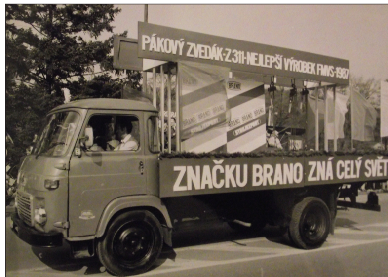
Alegorický vůz firmy 1. máje 1987 ▶