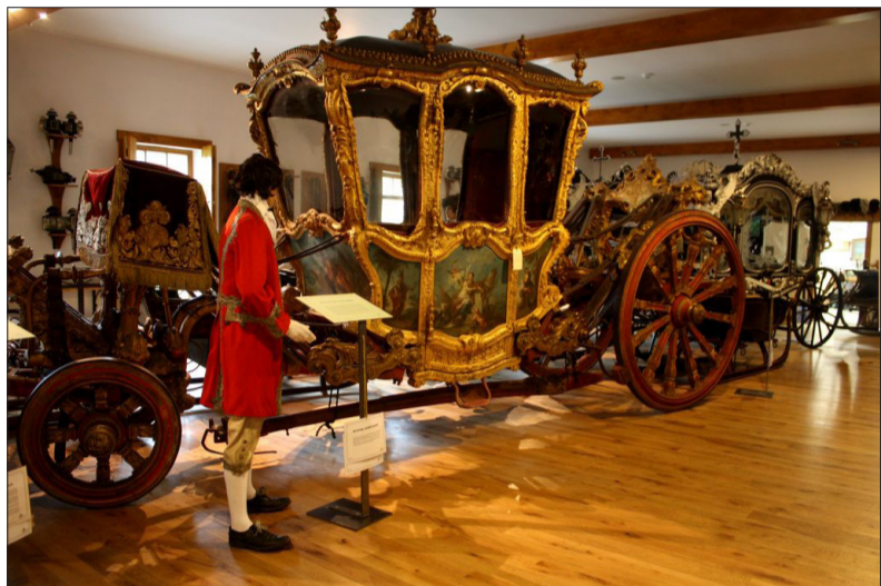
I takové skvosty má ono muzeum

„S vaším kladkostrojem jsme nadmíru spokojeni. Dokonale nám vyhovuje po všech stránkách,“ uvedl Václav Obr. Čechy pod Kosířem najdete pouhých 10 km od Prostějova. Muzeum kočárů má ve svých sbírkách například největší smuteční kočár všech dob. (mp)