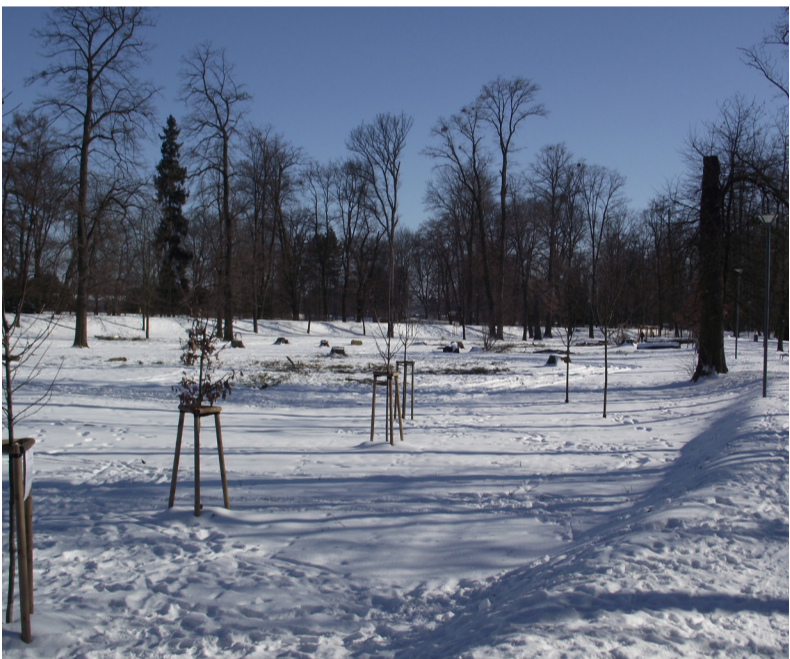
Procházka v zimním parku může dokonale pročistit hlavu a vzpružit unavené tělo. Využijte volna jak jen to nejlépe půjde