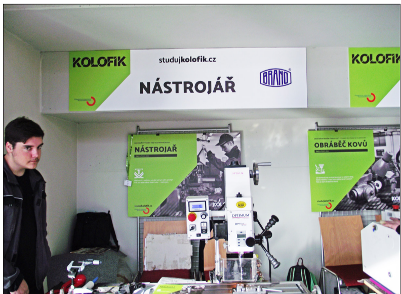
Střední technická škola v Opavě propaguje BRANO. Tady šlo konkrétně o akci Veletrh povolání 2022, na které jsme měli i svůj vlastní propagační stánek