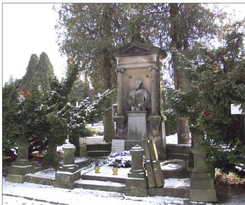
Zakladatel firmy BRANO odpočívá v rodinné hrobce na Městském hřbitově v Opavě. Hrobka je nyní ve vlastnictví současného podniku BRANO a v plánu je její renovace a celková údržba