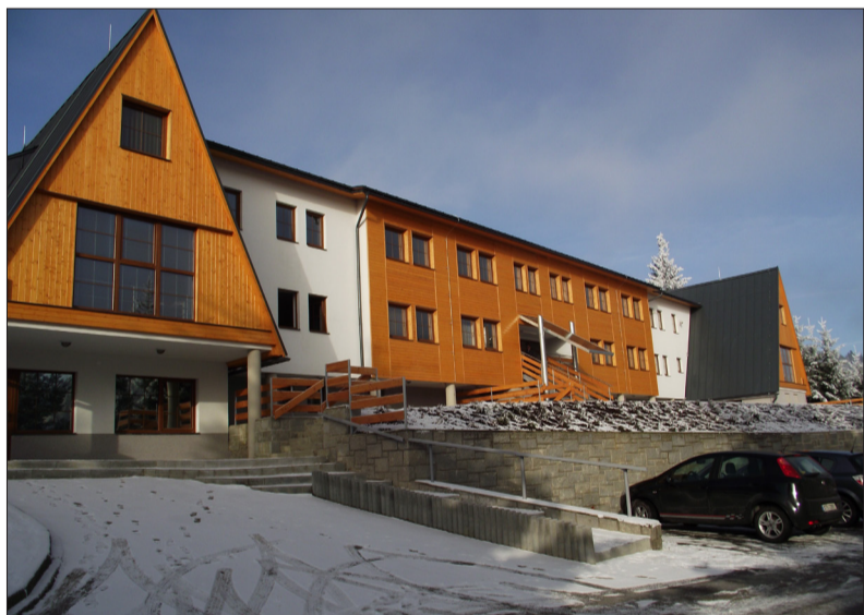
Nezapomeňte, v pátek 16. prosince se po rekonstrukci opět otvírá hotel BRANS