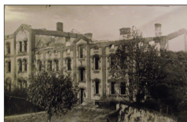
▲ BRANO v roce 1936