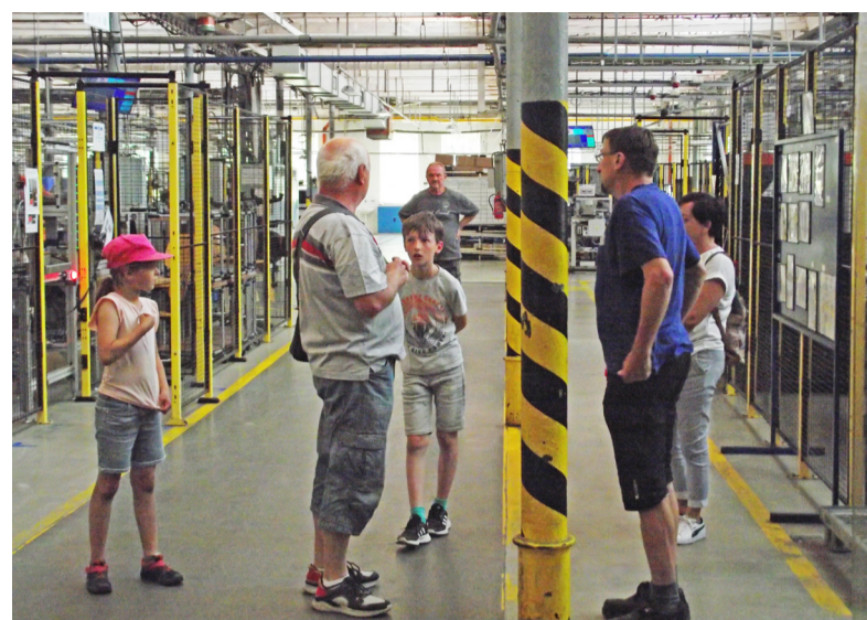
Letos opět došlo na Den otevřených dveří