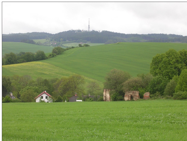
Česká Sibiř vypadá docela malebně

Možná se ptáte, proč vlastně název Česká Sibiř? A ptáte se dobře. V daném území totiž obecně panují drsnější klimatické podmínky, než jinde v republice (pokud nepočítáme horské krajiny). Zima je tady větší a delší. Výraz Česká Sibiř použil poprvé a také zpopularizoval novinář a spisovatel Jan Herben. Tento pán v roce 1907 napsal fejeton V České Sibiři, a to na základě vlastních zkušeností z pobytu zde. Prý byl tehdy i se svým společníkem překvapen jak velká zima tady panovala, když v Praze už měli skoro jaro.