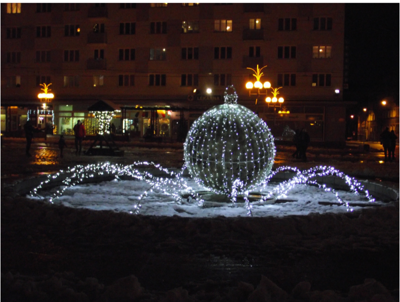
Loučíme se s přáním klidných Vánoc a šťastného vstupu do roku 2023