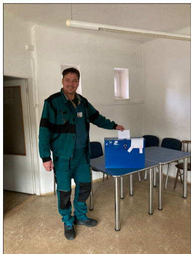
Volili se noví úsekoví důvěrníci