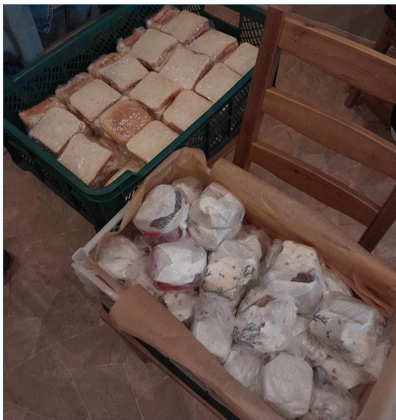
Část pomoci pro postižené

Základní organizace Odborového svazu KOVO BRANO v Hradci nad Moravicí děkuje všem, kdo se nějakým způsobem zapojili do pomoci lidem postiženým zářijovou povodní.