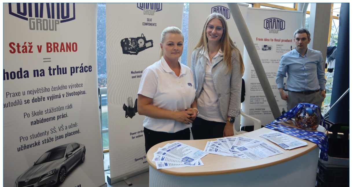
Náš prezentační stánek na akci Veletrh povolání v Opavě