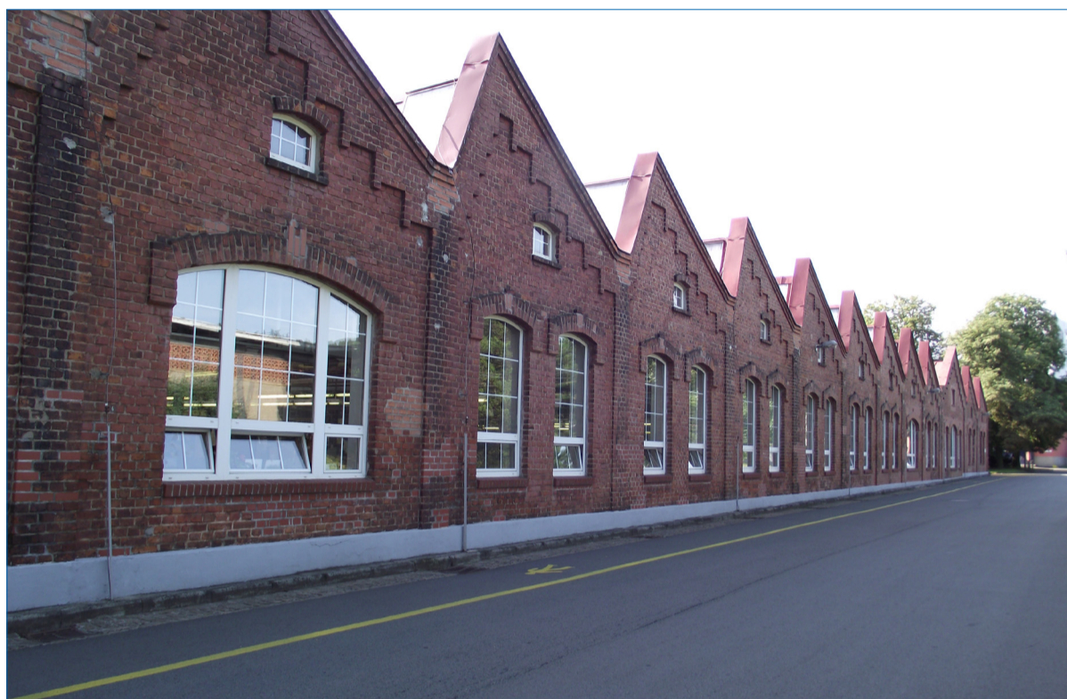
Historické budovy provozů už toho pamatují hodně