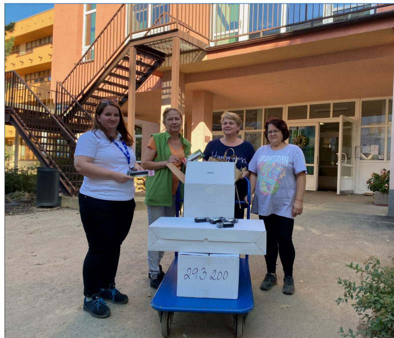
S pomocí se pokračovalo i v říjnu. Materiální pomoc dostal Domov pro seniory v Krnově. Poděkování patří všem, kdo se do pomoci zapojili.