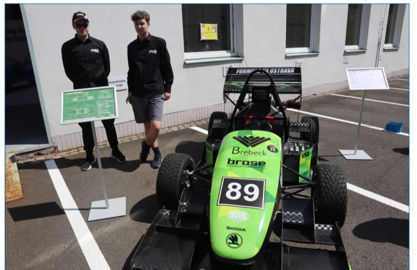
Pěkná formule, co říkáte?

Formula Team Vysoké školy báňské – Technické univerzity Ostrava, který podporuje BRANO GROUP, ukončil letošní závodní sezonu.